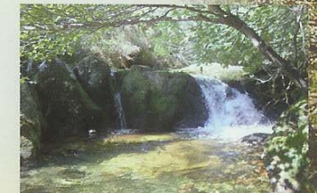
Río San Esteban