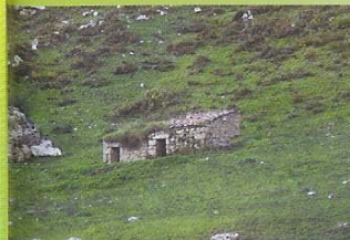
Cabaña en Sombetu

Las casas de la localidad, de Sa Esteban, son por lo general pequeñas y de tipo rural, con corredores de madera torneada. Próxima a esta localidad se encuentra el Área Recreativa y Bosque de San Esteban y el Mirador de Cueto La Bea.